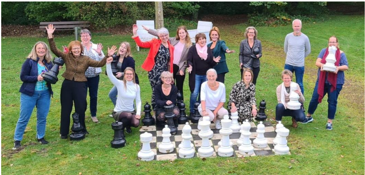
14 oktober 2021: coördinatoren tijdens kennisdeelbijeenkomst in Amersfoort