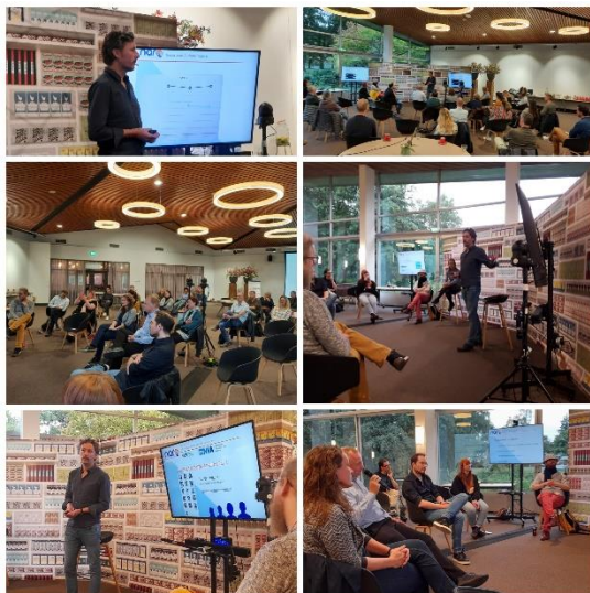
5 oktober 2021: Eenzaamheid