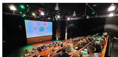
Op de foto: Wies Walters (SOTOG) tijdens avondbijeenkomst over autisme en trauma(verwerking) op 16 november 2023