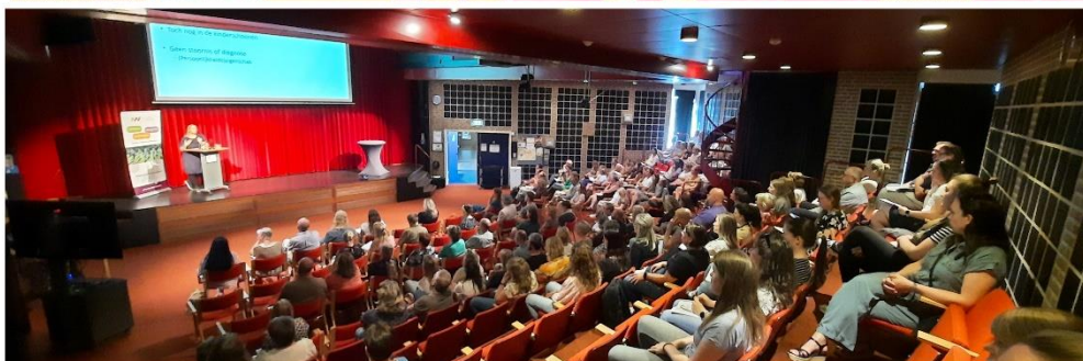
Bijeenkomst autisme & hoogsensitiviteit (8 juni 2023)