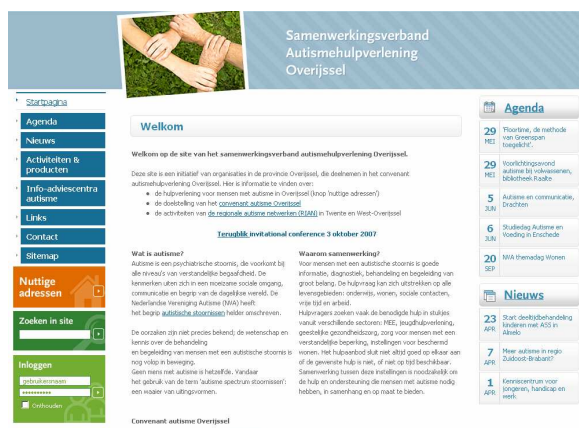
Afbeelding: startpagina www.autismeoverijssel.nl

Begin oktober 2007 is de website www.autismeoverijssel.nl gelanceerd. Deze site namens het samenwerkingsverband bevat een sociale kaart met adressen voor autismehulpverlening in de provincie en biedt informatie over activiteiten van de RIAN's en het intersectorale zorgprogramma, downloads en nieuws uit de regio en elders. De nieuwsitems worden regelmatig geactualiseerd en er verschijnt met enige regelmatig een digitale nieuwsbrief, waarvoor belangstellenden zich kunnen aanmelden. Met de website is een communicatieplatform voor het samenwerkingsverband beschikbaar gekomen voor een brede doelgroep: convenantpartners, professionals, cliënten en andere geïnteresseerden.